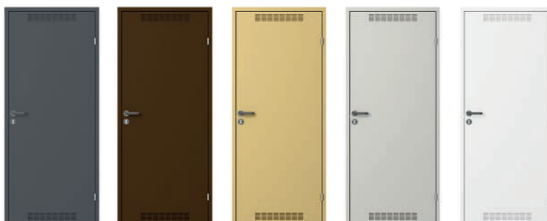
model 2 z wentylacją Antracyt (RAL 7024)

(skrzydło metalowe z zamkiem na wkładkę, ościeżnica metalowa kątowna, klamka z szyldem okrągłym i rozetą)