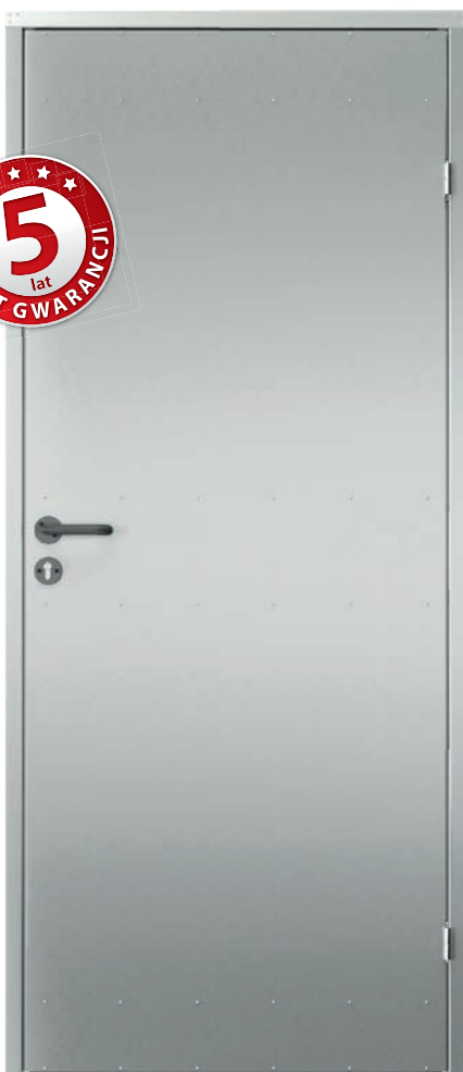
model 1 „pełne”, ocynkowane nielakierowane